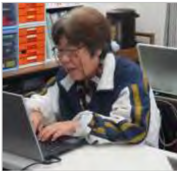
(パソコンを楽しんでいます)

新しい仕事を紹介してもらおうと、この歳になっても期待と不安でワクワクドキドキします。仕事が出来ると言うことは、幸せなことだと思います。 いつまでも気持ちだけは若く、これからも健康に気を付けて趣味に仕事に頑張ります。