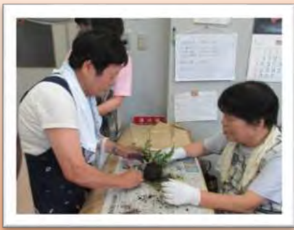
(7/7(金)ふれあい体験講座 苔玉づくり)