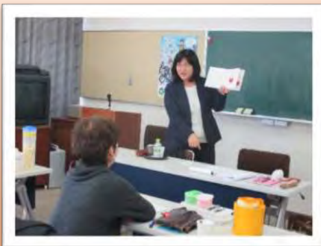
(2/14(水)育児支援サービス研修)

また、手芸班ではご家庭で不要となりました、綿の生地や毛糸等がございましたら、ご寄付いただきましたと思ひます。ご連絡いただければ、受け取りに参ります。ご協力お願い致します。